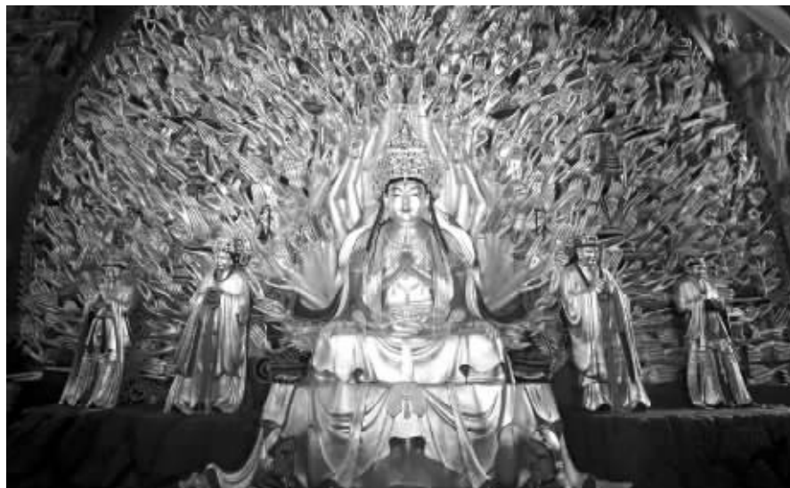
大足石刻千手观音造像

2017年12月，大足区就智能产业发展及智能化改造工作召开了座谈会，强调大足部门、企业应该积极转变思想认识，着眼现有企业、传统企业推进智能化改造。会上指出，大足区目前最紧要的有3点，推进企业机械化生产，推动智能车间智能工厂的逐步实现，此外通过发展智能制造产业，通过智能化设备制造达到创新化目的，还必须注明高端人才的引进，注重科研环境的塑造，不仅让人才“引得进