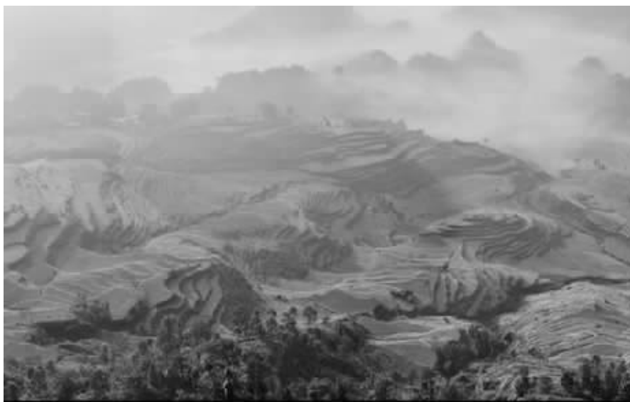
花田梯田一景

年,但代代种稻代代穷。人人以此为生,却从未凭此致富。山高路远,外村的姑娘一听何家岩就摇头。光见村里的姑娘嫁出去,就不见村里的汉子娶进外村女子来。