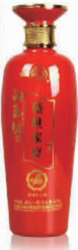
杏花村汾酒集团53度盛世家宴