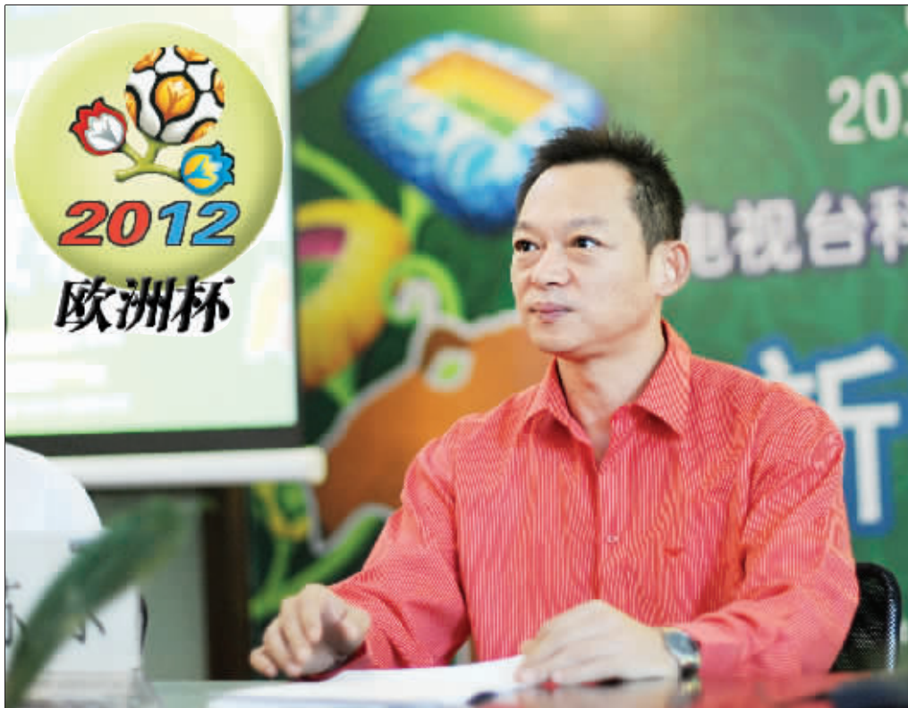
渝中区中山三路重庆电视台科教频道会议室,著名足球解说员苏东亲临现场

但他对此却有不同理解,“我希望球迷感觉是在现场看比赛。一场比赛下来,他们讨论的应该不是解说员,而是在解说员的帮助下,欣赏到一场精彩比赛。我始终认为解说员是不能有偏向的,只有嘉宾才可以有所倾向。”在这点上,苏东承认很佩服宋世雄老师,当年他的解说曾为对手喝彩。