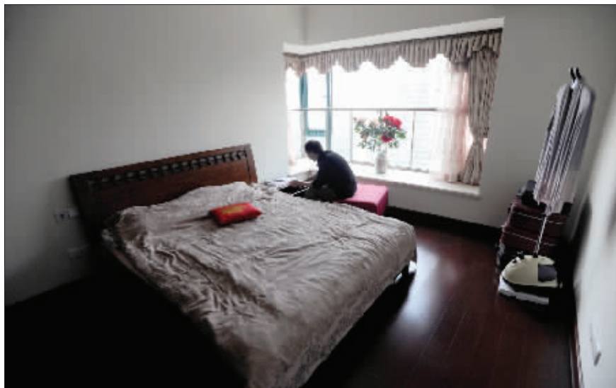
罗先生在卧室里整理抽屉

罗先生住在九龙坡一个新建的小区。刚刚搬进去住了一个多月，家里就被盗了。罗先生一直认为黄金保值，很多年前买的金项链和金戒指，一直舍不得戴，放在家里当存钱一样收藏。可是，家里进了小偷，这下，项链和戒指全部被小偷搜走了。